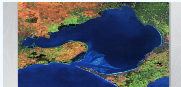
Мониторинг и контрол на драгажно петно.

Корес ЕООД е новоприета фирма за инкубиране, през май 2008г. Фирмата разработва проект за информационна система за мониторинг и контрол на драгажни петна в брегова зона.