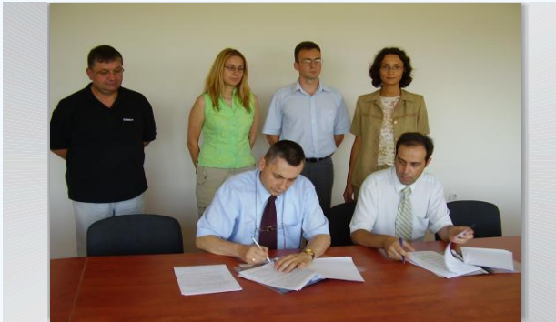
Подписване на договор за инкубиране с фирма Трейдърнет ЕООД.

Трейдърнет ЕООД е постъпила във ВТБИ- Варна през 2005г. при първата кампания за инкубиране на фирми с проекта си "Търговски и маркетингови решения за динамично фирмено интернет представяне и търговия". Фирмата е собственик на портала "Tradernet.bg", насочен към българските производители и търговци. Фирмата реализира амбициозната задача да предложи на българските производители и търговци бизнес решение, което е насочено към въпросите, стоящи пред всяка фирма, а именно как да представят продукцията и фирмена информация и да контактуват със своите клиенти по възможно най-ефективния начин. За периода си на инкубиране, който е 2 години, фирмата увеличава персонала си с трима души, 10 пъти нараства броя на клиентите ѝ, а нивото на популярност на портала се увеличава 6 пъти със 100 000 месечни посещения.