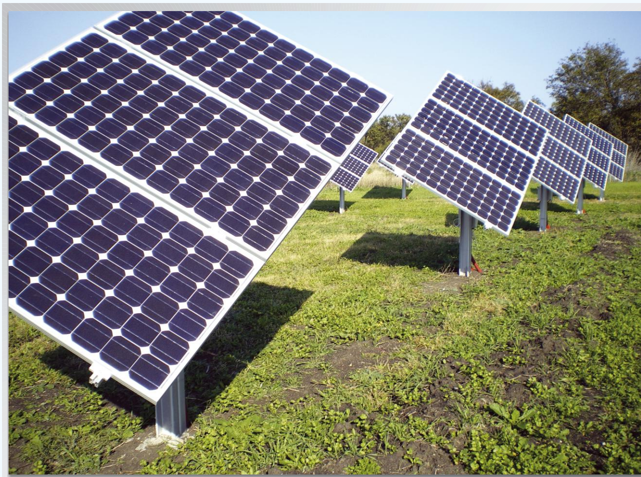
Фотоволтаична централа, изградена от ЗК ООД.