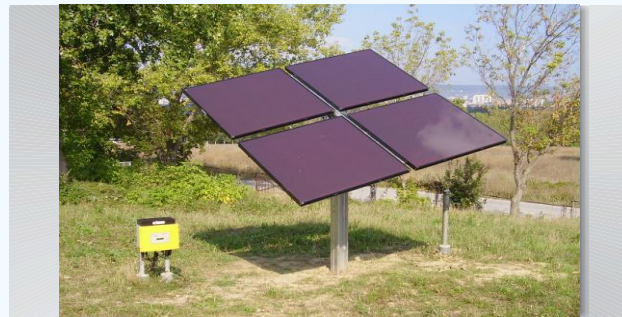
Следящ соларен панел, разработен от ЗК ООД.

Проектът, с който фирмата е приета за инкубиране е "Последна електрическа миля" или телекомуникации по електрическата мрежа, посредством PLC технология. Тази технология осъществява изграждане на мрежи за високоскоростен Интернет по съществуващите електро- разпределителни мрежи. Тя намира широко приложение в изграждането на информационни мрежи в училища, болници, офиси, хотели, търговски центрове, обществени сгради, туристически обекти и др. За това време фирмата увеличи своя оборот повече от 8 пъти.