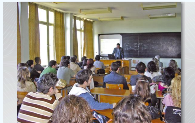
Среща на екипа на РАПИВ със студенти от ИУ-Варна.

Редица кръгли маси и индивидуални бизнес консултации по евро фондове и програми са проведени с високотехнологични фирми от Варна и региона. Стартира и нова кампания за набиране на фирми за инкубиране във Високотехнологичен бизнес инкубатор към РАПИВ. Проведени са две срещи на екипа на РАПИВ със студенти от Икономически университет-Варна, на които са представени възможности за финансиране на иновативни МСП по различни програми.